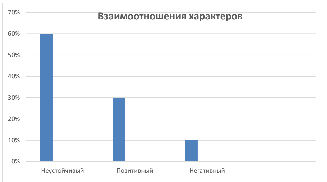
Рисунок № 2 – «Взаимоотношение характеров»

По графику «взаимоотношение характеров» (Рисунок. 2) отражает представление родителя о близости к нему ребенка. В нашем случае наблюдаются достоверные различия, что указывает на неточность представлений родителей об эмоциональной близости к ним подростка, точнее сказать о переоценки родителями этого показателя. Подростки в меньшей степени ощущают свою эмоциональную близость с родителями, желание делиться с ними самым сокровенным и важным.