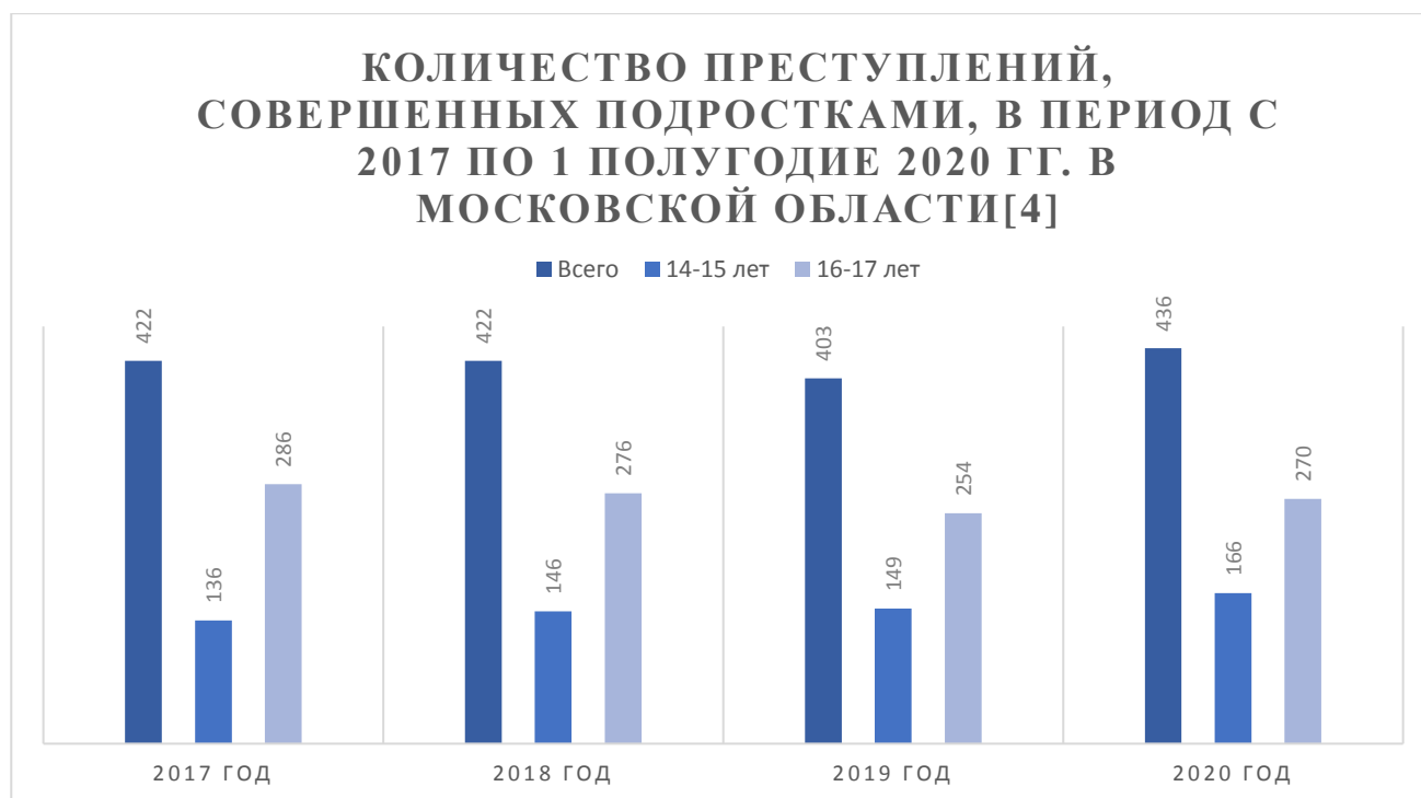
Рисунок №1 – «Количество преступлений, совершенных подростками»

Исходя из графика, можно сделать вывод, что общее количество преступлений среди подростков удержится примерно на одном уровне, но у категории 14-15 лет виден заметный рост (Рисунок № 1).