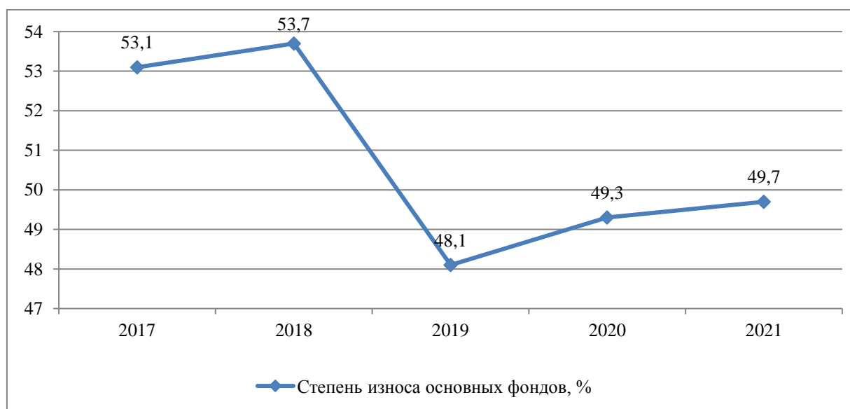
Рисунок 4 – Динамика степени износа основных фондов долга за период 2017 – 2021 гг.

Рассмотрев рисунок 3, можно сделать вывод, что ВРП на душу населения в Саратовской области имеет устойчивую тенденцию к увеличению. Но одновременно с этим оно остается относительно низким по сравнению с другими субъектами Российской Федерации.